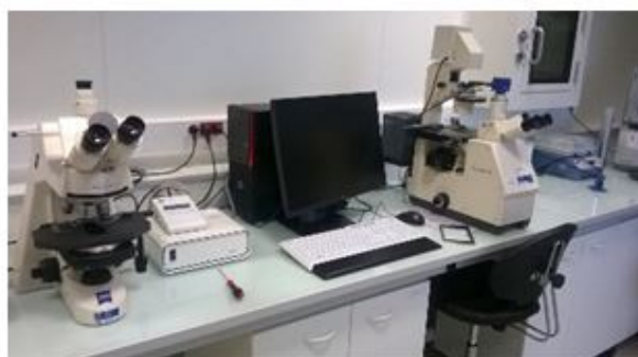
Microscope à fluorescence avec plateforme motorisée (screening moyen-débit en secteur de niveau de confinement 2 (L2))