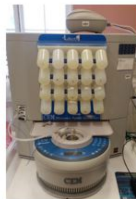
Synthétiseur de peptides sur support solide Liberty 1 (CEM)