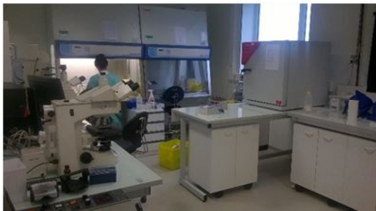
Secteur de niveau de confinement 3 (Laboratoire de sécurité microbiologique L3)