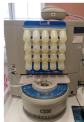
Synthétiseur de peptides sur support solide Liberty 1 (CEM)