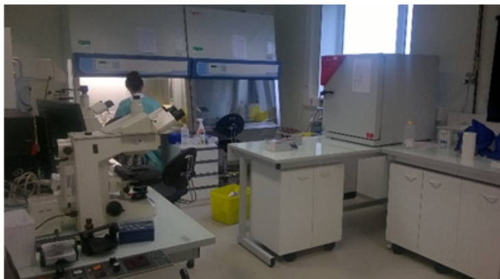
Secteur de niveau de confinement 3 (Laboratoire de sécurité microbiologique L3)