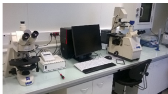
Microscope à fluorescence avec plateforme motorisée (screening moyen-débit en secteur de niveau de confinement 2 (L2))